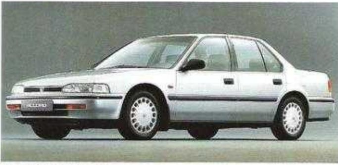
2.0i, 98 kW (133 PS)