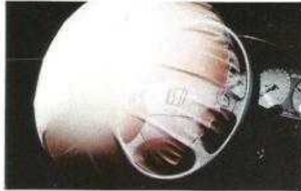
Airbag-Sicherheits- system auf Wunsch (nur in der Kombination mit 4WS-Vierradlenk- system)