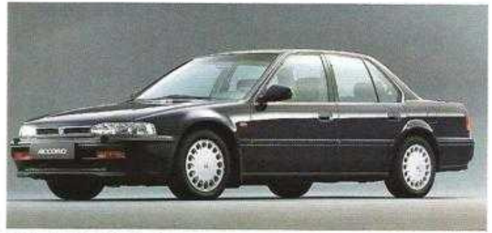
2.2i, 110 kW (150 PS)