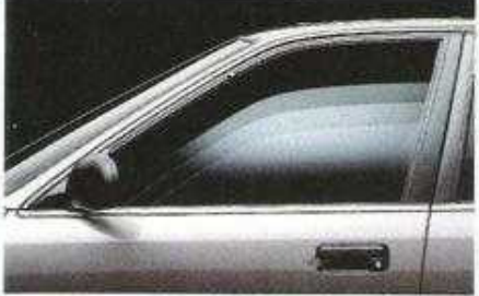
Elektrisch bedienbare Fensterheber