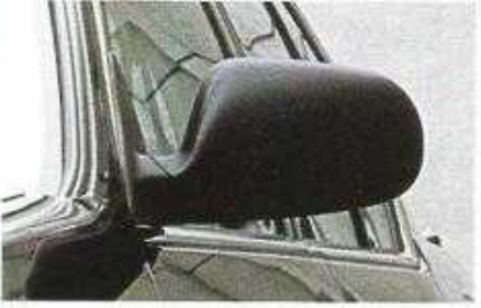
Elektrisch bedienbare Außenspiegel