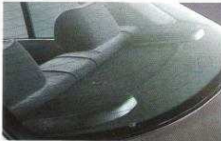
Höhenverstellbare Kopfstützen hinten*