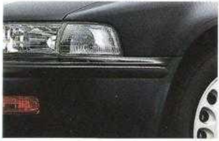
In Wagenfarbe lackierte Stoßfänger