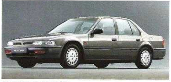
2.0, 66/81 kW (90/110 PS)