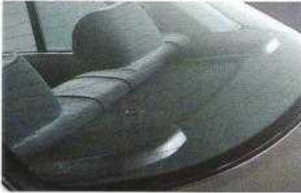
Höhenverstellbare Kopfstützen hinten